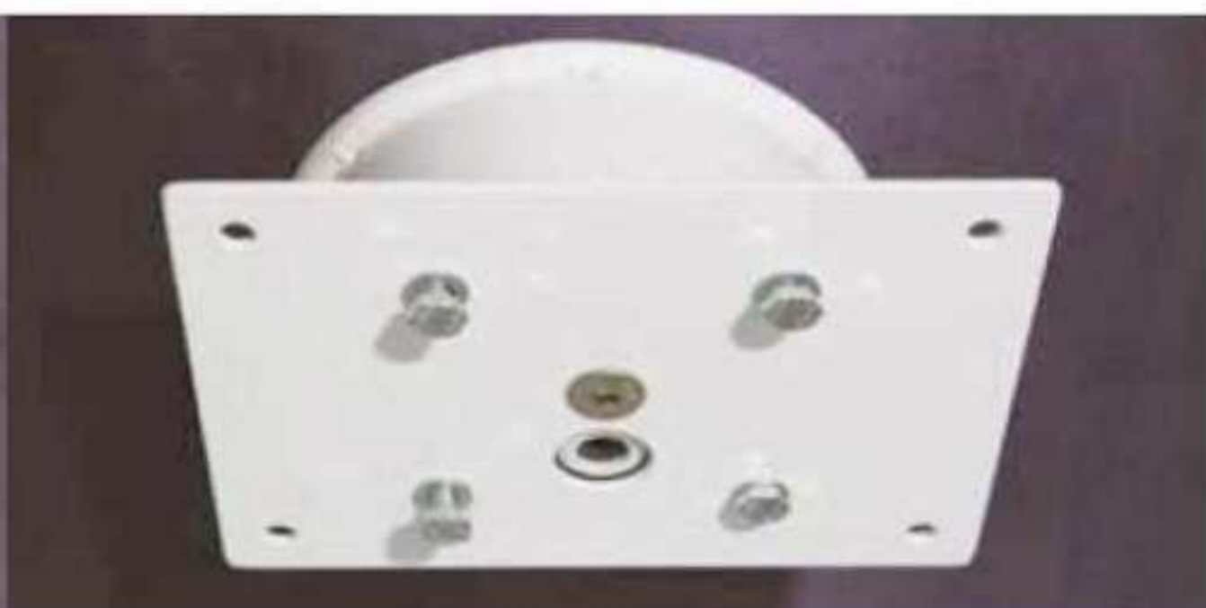
Kwadratowa podstawa montażowa dla płaskich systemów mocujących 160x120mm