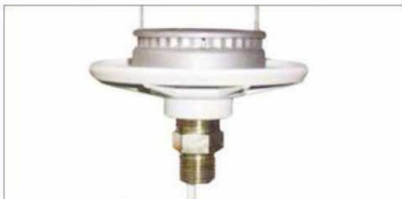
Kompaktowy panel osłonowy gwint 3/4"