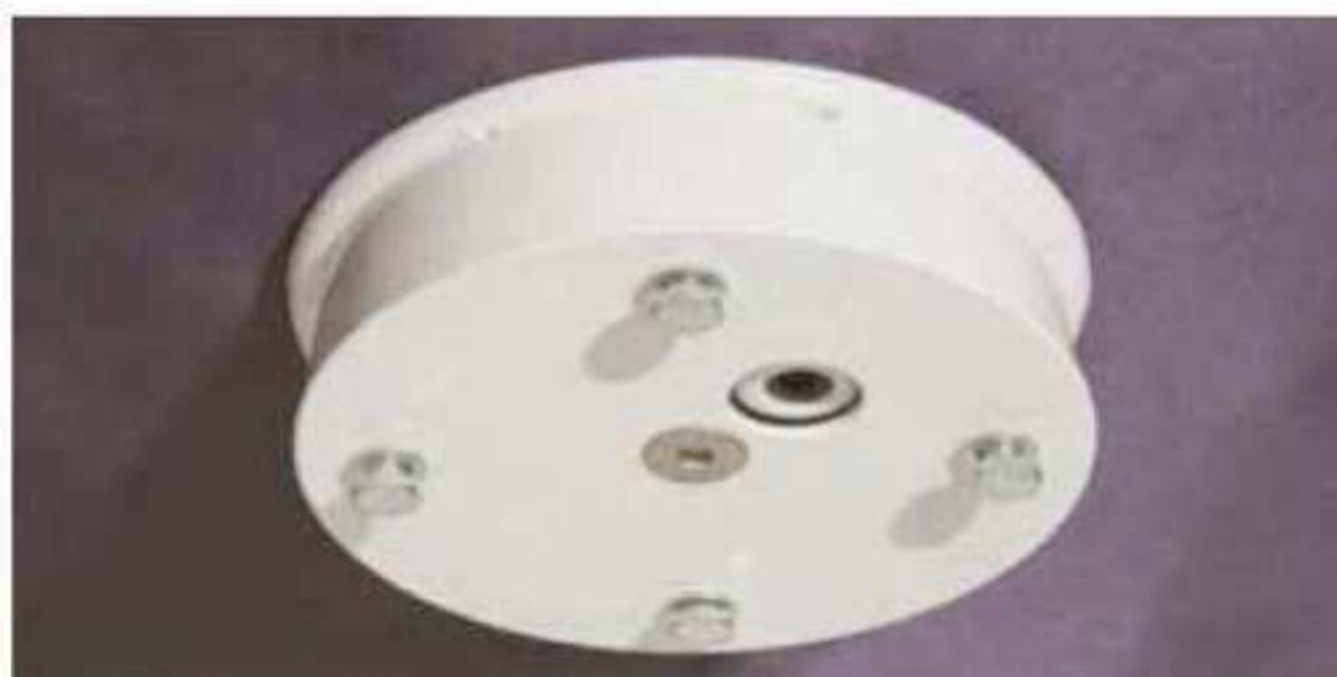
Okrągła podstawa montażowa, maskująca moduł wciągarki Ø 120mm